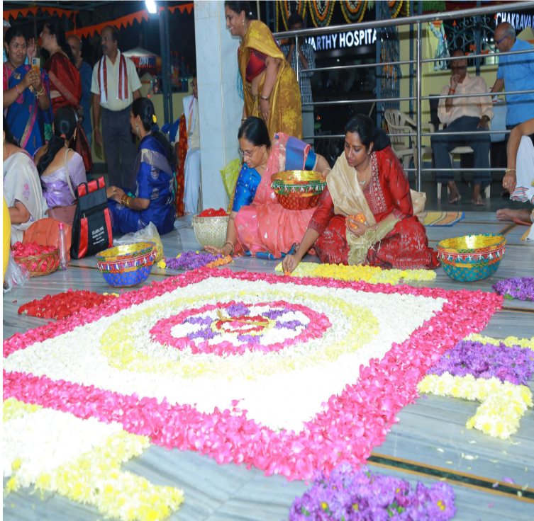
మన దునియా, బాలసమద్రం, ఫిబ్రవరి 26

బాలసముద్రం, ఏకశిలాపార్కు సమీపంలోని శ్రీ సీతారామచంద్ర ప్రసన్నాంజనేయస్వామి దేవాలయంలో నిర్వహిస్తున్న ద్విపూర్ణ ప్రయత్న వట్టాభిషేకోత్సవాత్మక పంచామిక్ పుష్కర బ్రహ్మోత్సవాలకు వరంగల్ పార్లమెంట్ సభ్యురాలు డాక్టర్ కడియం కావ్య పాల్గొన్నారు. ఈ ఉత్సవాలలో భాగంగా గురువారం నిర్వహించిన పుష్కర కార్యక్రమంలో వరంగల్ ఎంపీ డా. కడియం కావ్య ప్రత్యేక పూజలు చేశారు. ఈ సందర్భంగా ఎంపీ డా. కడియం కావ్య మాట్లాడుతూ, ఆధ్యాత్మికతతో సమాజంలో శాంతి, ఐక్యత, సద్భావన పెరుగుతాయన్నారు. శ్రీ సీతారామచంద్ర ప్రసన్నాంజనేయస్వామి ఆశీస్సులతో ప్రజలందరికీ సుఖంతోషాలు, ఆరోగ్యం, సమృద్ధి చేకూరాలని ఆకాంక్షించారు. ఇటువంటి సంప్రదాయ ఉత్సవాలను తరతరాలకు నిలుపుకోవడం ప్రతి ఒక్కరి బాధ్యత" అని