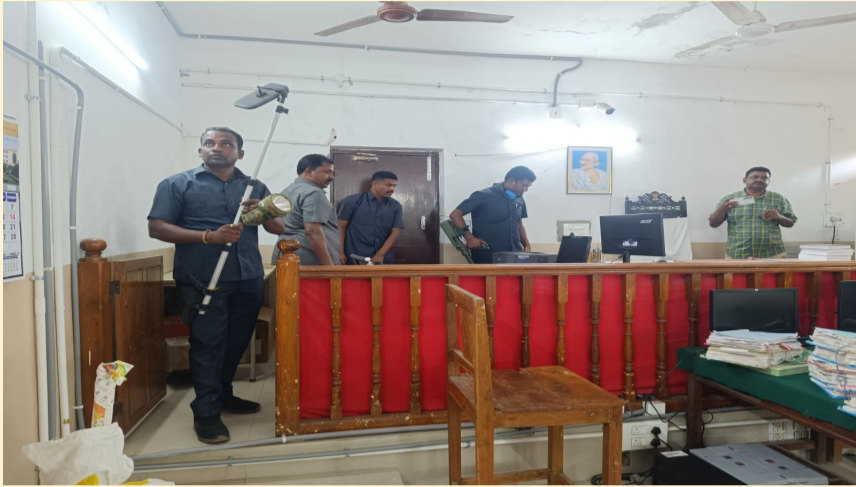
మన దునియా, సుబేదారి ఫిబ్రవరి 26

హనుమకొండ సుబేదారి ప్రాంతంలోని కోర్టుకు బాంబు బెదిరింపులు రావడంతో ఉద్రిక్త పరిస్థితులు నెలకొన్నాయి. గతంలో కూడా పలుమార్లు ఫోన్ కాల్స్ ద్వారా బెదిరింపులు వచ్చినట్లు సమాచారం. ఈ రోజు కూడా వచ్చిన సమాచారం మేరకు అప్రమత్తమైన పోలీసులు వెంటనే కోర్టు భవనంలో ఉన్న న్యాయవాదులు, సిబ్బంది, ప్రజలను బయటకు పంపించారు. సుబేదారి పోలీసులు కోర్టుకు చేరుకుని భద్రతా చర్యలు చేపట్టారు. బాంబు స్టాండ్ సిబ్బంది ప్రత్యేక పరికరాలతో కోర్టు ప్రాంగణాన్ని తనిఖీ చేస్తున్నారు. ఏదైనా అనుమానాస్పద వస్తువు ఉందా అనే దానిపై అధికారులు క్షుణ్ణంగా పరిశీలిస్తున్నారు. బెదిరింపుల వెనుక ఉన్న వ్యక్తులపై పోలీసులు దర్యాప్తు ప్రారంభించారు. ఈ ఘటనతో కోర్టు పరిసరాల్లో ఉద్రిక్త వాతావరణం నెలకొంది.