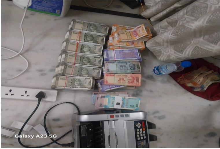
మన దునియా, హనుమకొండ జిల్లా: ఏప్రిల్ 03