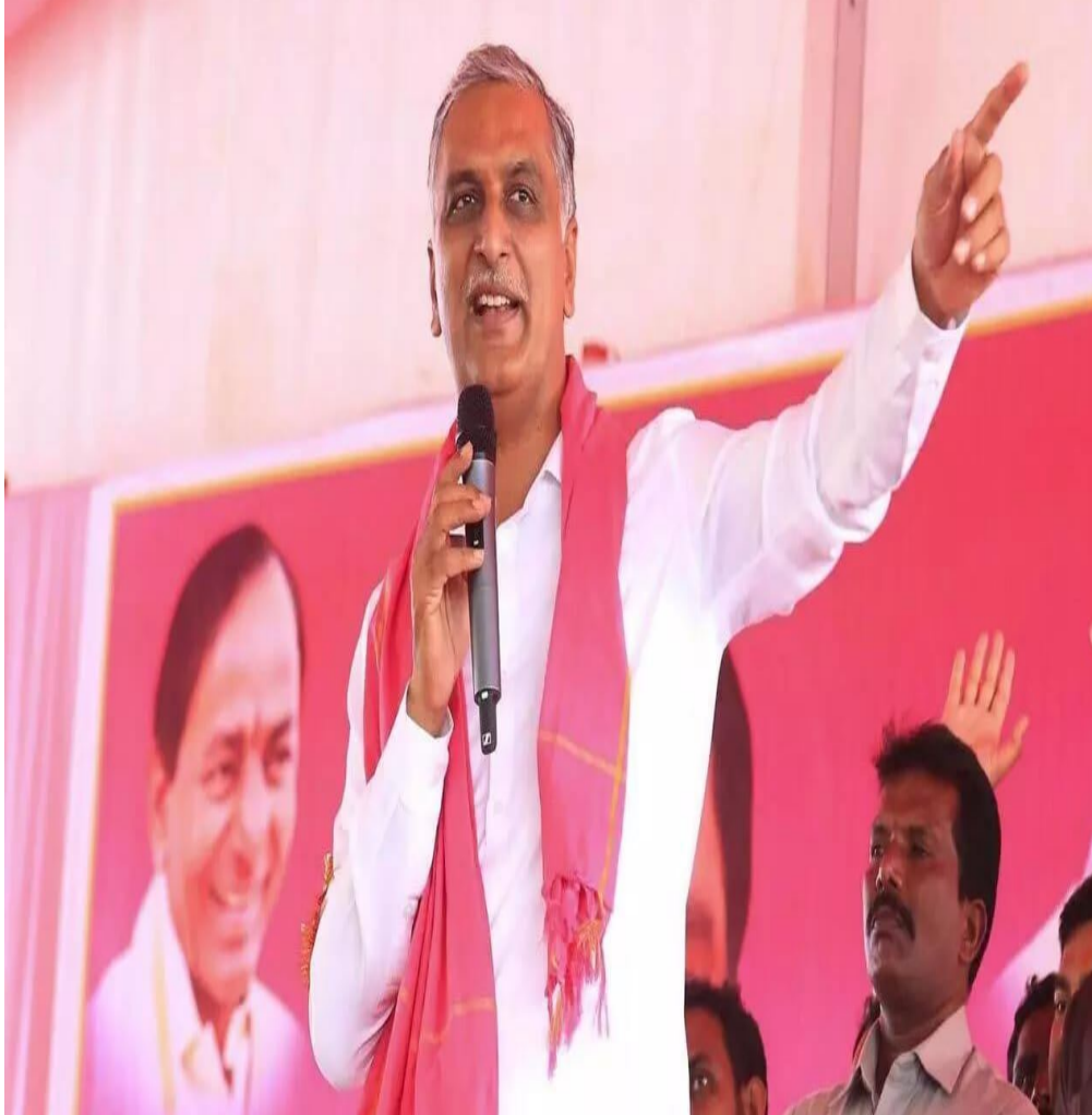
అదరదు బెదరదు. ప్రజాక్షేత్రంలో మిమ్మల్ని అదుగదుగునా నిలదీస్తూనే ఉంటం, ప్రజల తరపున పోరాటం చేస్తూనే ఉంటాం. అన్నారు. ఎమ్మెల్యే క్యాంపు కార్యాలయం పై దాడులు జరిపిన కాంగ్రెస్ గూండాలను గుర్తించి వెంటనే ఆర్ఎస్ చేయాలని రాష్ట్ర డీజీపీని

ప్రజాస్వామ్యంపై సీఎం చేయించిన దాడి అన్నారు. పట్టపగలు అధికార మదం తో విప్రవీగుతూ సోయి మరచి వ్యవహారాన్ని రిస్తున్న కాంగ్రెస్ నాయకుల తీరు బీహార్ గ్యాంగ్ ను తలపిస్తోందన్నారు. ఏకంగా ప్రజా ప్రతినిధుల క్యాంపు కార్యాలయాలపైనే ముప్పేట దాడులు చేస్తుంటే రాష్ట్రంలో శాంతి భద్రతలు ఉన్నట్లా లేనట్లా? అని ప్రశ్నించారు. కాంగ్రెస్ పాలనలో ప్రజా ప్రతినిధులపై దాడులు, ప్రజా సంఘాలపై దాడులు, మీడియాపై దాడులు.. నిత్యతృప్తం కావడం సిగ్గుచేటన్నారు. శాంతి భద్రతలను కాపాడాల్సిన పోలీసు యంత్రాంగం కాంగ్రెస్ పార్టీకి ప్రైవేట్ సైన్యంలా మారిపోయారా? ఎందుకు అడ్డుకోవడం లేదు? అని ప్రశ్నించారు. ఒకవైపు “హిట్ స్వీప్ బిల్” పేరుతో ప్రజలు, ప్రతిపక్షాల నోళ్ల మూయిస్తూ మరో వైపు కాంగ్రెస్ గూండాలతో దాడులు చేయించడమేనా మీ ప్రజా పాలన? ఇందిరమ్మ రాజ్యం అని చెబుతూ గూండా రాజ్యం అమలు చేస్తారా? సీఎం, మంత్రులు ఇతర రాష్ట్రాల్లో పొలిటికల్ టూర్లు చేస్తూ పాలనను గాలికి వదిలేసారా? ముఖ్యమంత్రి, మంత్రులు ఇతర రాష్ట్రాల ఎన్నికల ప్రచారంలో ఉంటే ఇక్కడ పాలనను ఎవరు చేశారని ప్రశ్నించారు. బీఆర్ఎస్ ఎమ్మెల్యేల కార్యాలయాలపై దాడులు చేయాలని సందేశాలు ఇచ్చారా? కాంగ్రెస్ నాయకులకు ఫ్రీ హ్యాండ్ ఇచ్చారా? గ్యారంటీగా ప్రజాస్వామ్య పునరుద్ధరణ అని డబ్బా కొట్టి ఇప్పుడు, ఉన్న ప్రజాస్వామ్యాన్ని ఖానీ చేశారు. ఎమర్జెన్సీ పాలనను తలపిస్తున్నారు. మీ అణచివేతలకు, మీ నిర్బంధాలకు, మీ దాడులకు బిఆర్ఎస్ పార్టీ