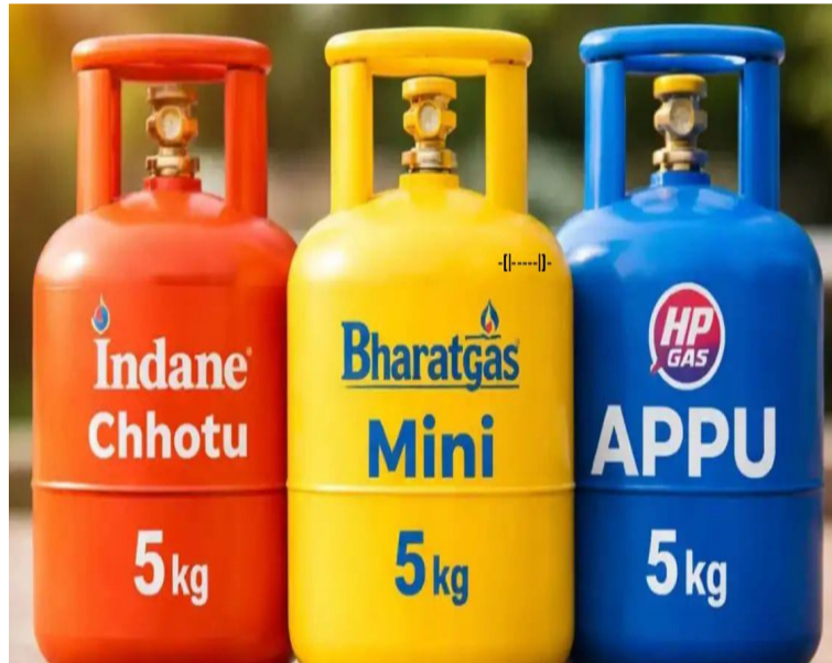
చేసింది. పెట్రోల్ పంపుల్, కిరాణి దుకాణాలు, సూపర్ మార్కెట్లు, ఇండెన్ పంపిణీదారుల వద్ద దీనిని కొనుగోలు చేయవచ్చు. ఏ నగరంలో అయినా దీనిని వినియోగించుకోవచ్చు. ఇక భారత్ గ్యాస్ మినీ సిలిండర్ అయితే మీ ఇంటి వద్దకే వచ్చేస్తుంది. 1800224344 నెంబర్ కు కాల్ చేస్తే రెండు గంటల్లోనే మీ ఇంటికి డెలివరీ చేస్తారు . అయితే రూ.25 డెలివరీ ఛార్జ్ కట్టాల్సి ఉంటుంది. ఇక హెచ్ పీ గ్యాస్ అప్పు పేరుతో 5 కేజీ ల సిలిండర్ ప్రవేశపెట్టింది. పెట్రోల్ బంక్లు, విక్రయ కేంద్రాలు, కిరాణి దుకాణాల్లో దీనిని పొందవచ్చు.

గ్యాస్ సిలిండర్ అంటే ఇప్పటివరకు 14.2 కిలోల ఇంట్లో వాడే సిలిండర్, హోట్టెల్స్, రెస్టారెంట్స్ లాంటి వ్యాపారాలకు వాడే 19 కిలోల సిలిండర్ గురించి మనందరికీ తెలుసు...!! అయితే ఇప్పుడు 5 కిలోల సిలిండర్లు కూడా అందుబాటులోకి వచ్చేశాయి. ఈ మేరకు అన్ని గ్యాస్ కంపెనీలు 5 కేజీల సిలిండర్లను ప్రవేశపెట్టాయి. ఇటీవల గ్యాస్ సరఫరాలో అంతరాయం కలిగిన క్రమంలో కంపెనీలు ఈ నిర్ణయం తీసుకున్నాయి. ఇండెన్, భారత్ గ్యాస్, హెచ్ పీ గ్యాస్ కంపెనీలన్నీ ఈ చిన్న సిలిండర్లను మార్కెట్లోకి తెచ్చాయి. అద్దెఇళ్లలో ఉంటున్న విద్యార్థులు, ఉద్యోగులు, వలస కార్మికులకు ఎంతో ఉపయోగపడుతుంది. దీని వివరాలు ఏంటో ఇప్పుడు చూద్దాం.