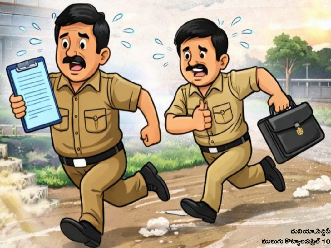
పం న దునియా, సిద్దిపేట జిల్లా ములుగు కొట్కాల, ఏప్రిల్ 10

పంటలను కాపాడిన తక్షణ నిర్ణయం ఫామ్ హౌస్ నుంచే ప్రభావం చూపిన నేత ఆదేశం వెంటనే అమలు చేసిన యంత్రాంగం రైతుల కష్టాలకు చిటికెలో పరిష్కారం