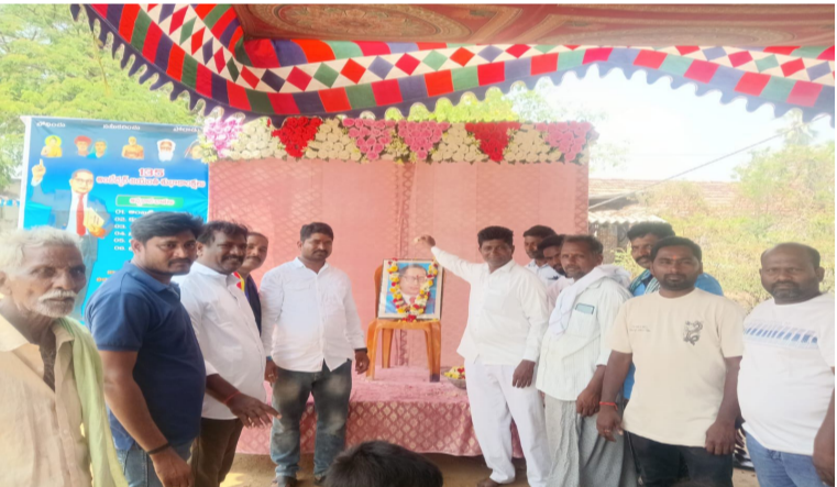
ఖానాపూర్ ఆర్ట్స్ మన దునియా ఏప్రిల్: 14.