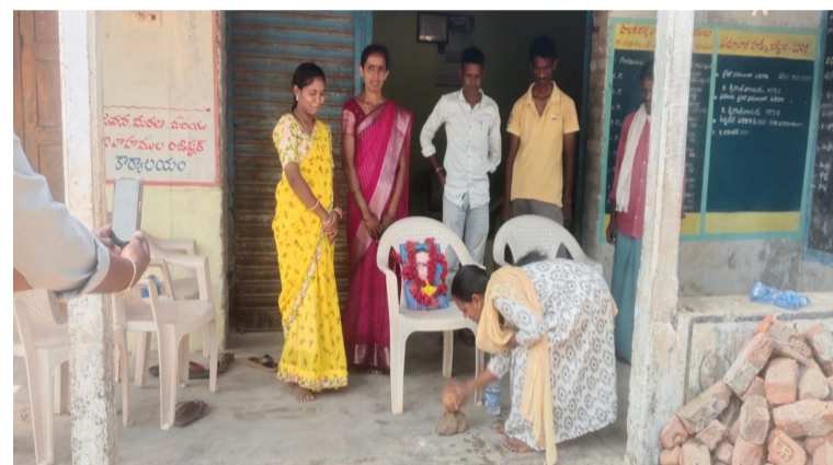
మన దునియా, వాణిపట్ల ఏప్రిల్ 14