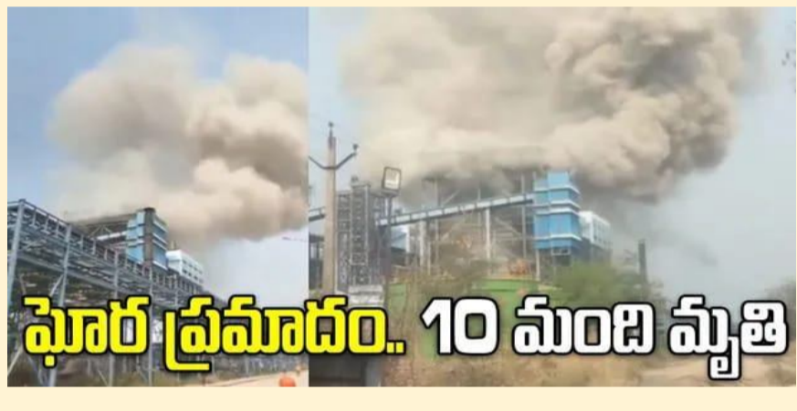
మన దునియా,ఛత్తీస్ గఢ్,ఏప్రిల్ 14

ఛత్తీస్ గఢ్ లో ఘోర ప్రమాదం చోటుచేసుకుంది. సక్తి జిల్లాలోని వేదాంత పవర్ ప్లాంట్లో బాయిలర్ పేలుడంతో 10 మంది కార్మికులు మృతి చెందగా, సుమారు 40 మంది గాయపడ్డారు. ఈ ఘటన అకస్మాత్తుగా బాయిలర్ లో సాంకేతిక లోపం తలెత్తడంతో జరిగినట్లు అధికారులు అనుమానిస్తున్నారు. పేలుడు తీవ్రత ఎక్కువగా ఉండటంతో ప్లాంట్ పరిసర ప్రాంతాల్లో భయాందోళనలు నెలకొన్నాయి. సంఘటన సమయంలో అక్కడ పనిచేస్తున్న కార్మికులు తీవ్రంగా గాయపడ్డారు. గాయపడిన వారిని సమీప ఆసుపత్రులకు తరలించి చికిత్స అందిస్తున్నారు. వారిలో కొందరి పరిస్థితి విషమంగా ఉన్నట్లు సమాచారం. ప్రమాదం గురించి సమాచారం అందుకున్న వెంటనే పోలీసులు, అగ్నిమాపక సిబ్బంది ఘటనాస్థలానికి చేరుకుని సహాయక చర్యలు చేపట్టారు. ఈ ఘటనపై అధికారులు విచారణ ప్రారంభించారు. ప్రమాదానికి గల అసలు కారణాలు ఏమిటి అనే దానిపై పరిశీలన కొనసాగుతోంది. బాధిత కుటుంబాలకు ప్రభుత్వం సహాయం అందించనున్నట్లు అధికారులు తెలిపారు. ఈ ప్రమాదం మరోసారి పారిశ్రామిక భద్రతపై ప్రశ్నలు లేవనెత్తుతోంది. భారీ పరిశ్రమల్లో భద్రతా ప్రమాణాలను కచ్చితంగా పాటించాల్సిన అవసరం ఉందని నిపుణులు సూచిస్తున్నారు..