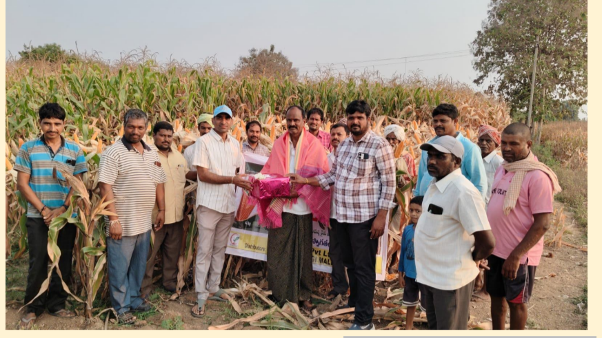
సంగం (మన దునియా )