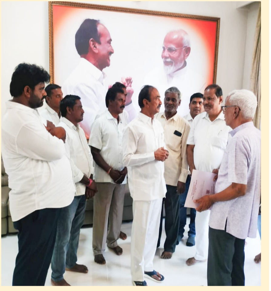
మన దునియా, వరంగల్ జిల్లా చెన్నారావుపేట, పాపయ్యపేట: ఏప్రిల్ 20

“మెపా” సహకారంతో... రాష్ట్ర స్థాయి ముదిరాజ్ పెద్దలను కలిసిన పాపయ్యపేట ముదిరాజ్ లు