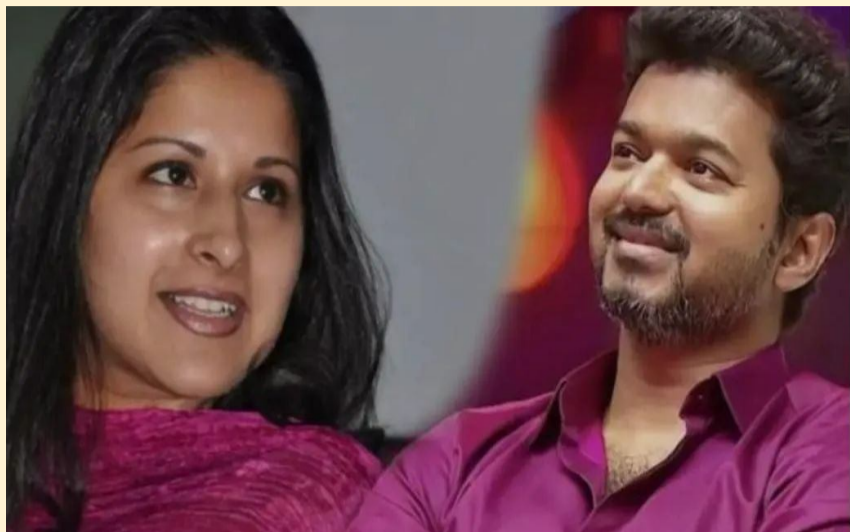
మన దునియా, తమిళనాడు: ఏప్రిల్ 20