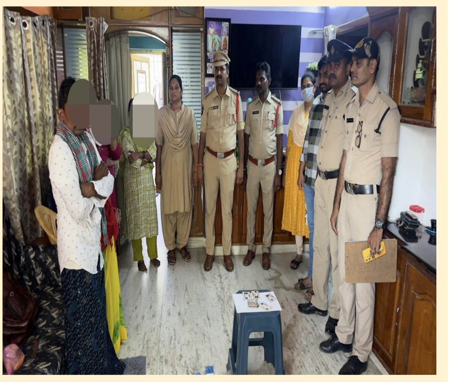
మన దునియా, చిలకలూరిపేట: ఏప్రిల్ 20

చిలకలూరిపేట: పట్టణంలోని ఎన్.ఆర్.టి సెంటర్ సమీపంలో గల సరళ నర్సింగ్ హోమ్ వీధిలో గుట్టుచప్పుడు కాకుండా సాగుతున్న వ్యభిచార కేంద్రంపై పోలీసులు మెరుపు దాడి చేశారు. అసాంఘిక కార్యకలాపాలు జరుగుతున్నాయన్న ముందస్తు సమాచారంతో, సోమవారం సాయంత్రం అర్బన్ సి.ఐ.పి. రమేష్ తన సిబ్బందితో కలిసి ఒక ఇంటిపై దాడి నిర్వహించారు. ఈ దాడిలో వ్యభిచారం నిర్వహిస్తున్న ఓ మహిళతో పాటు, విటుడు మరియు మరో ఇద్దరు మహిళలను పోలీసులు అదుపులోకి తీసుకున్నారు. వారి వద్ద నుండి రూ. 3,650 నగదు మరియు ఇతర వస్తువులను స్వాధీనం చేసుకున్నారు. నిందితులపై కేసు నమోదు చేసి దర్యాప్తు చేస్తున్నట్లు పోలీసులు తెలిపారు.