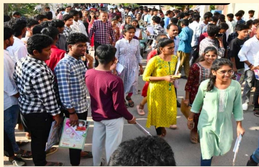
మన దునియా, హైదరాబాద్: ఏప్రిల్ 20

తెలంగాణ ఇంటర్మీడియట్ అడ్వాన్స్డ్ సెక్షన్లలో పరీక్షలకు సంబంధించి విద్యార్థులకు మరో అవకాశం కల్పిస్తూ.. ఇంటర్ బోర్డు కీలక నిర్ణయం తీసుకుంది. ఫీజు చెల్లింపు గడువును పెంచుతూ తాజా ఉత్తర్వులు జారీ చేసింది. తెలంగాణ స్టేట్ బోర్డ్ ఆఫ్ ఇంటర్మీడియట్ ఎడ్యుకేషన్, ప్రకటించిన వివరాల ప్రకారం.. అడ్వాన్స్డ్ సెక్షన్లలో పరీక్షల ఫీజు చెల్లింపు గడువును ఈ నెల 23వ తేదీ వరకు పొడిగించారు. వాస్తవానికి ఈ గడువు అంతకుముందే ముగియాలి ఉన్నప్పటికీ.. విద్యార్థులు, తల్లిదండ్రుల అభ్యర్థన మేరకు బోర్డు ఈ వెసులుబాటు కల్పించింది. ప్రథమ, ద్వితీయ సంవత్సరాలలో మార్కులు తక్కువ గా వచ్చి, ఇంప్రూవ్ మెంట్ రాసుకోవాలనుకునే కూడా వీటికి దరఖాస్తు చేసుకోవచ్చు. అంతే కాకుండా.. పరీక్షల్లో ఉత్తీర్ణత సాధించ లేక పోయిన విద్యార్థులు తమ విద్యా సంవత్సరాన్ని కాపాడుకోవడానికి ఈ సెక్షన్లలో పరీక్షలకు హాజరుకావచ్చు. జనరల్ మరియు వాకేషనల్ కోర్సుల విద్యార్థులందరికీ ఈ అవకాశం వర్తిస్తుంది.