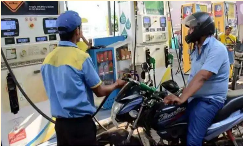
మన దునియో, న్యూఢిల్లీ, మే 01