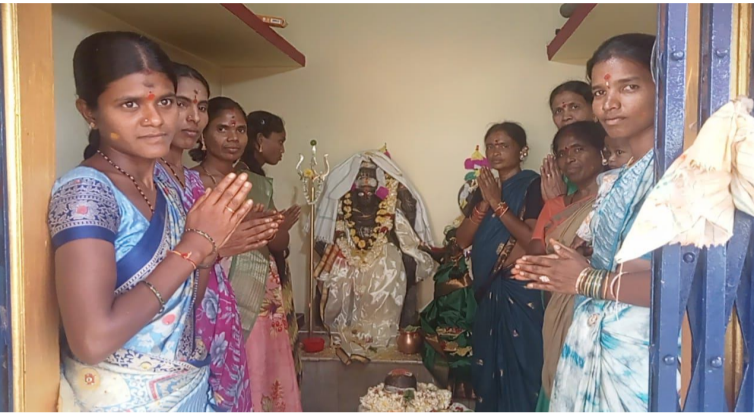
(మే 1) మన దునియో, మోపాల్:

నిజామాబాద్ జిల్లా మోపాల్ మండలం నర్సింగ్ పల్లి గ్రామంలో గంగమ్మ కళ్యాణోత్సవం రంగా రంగా వైభవంగా నిర్వహించారు ఈ సందర్భంగా ఆలయ కమిటీ సభ్యులు మాట్లాడుతూ ప్రతి సంవత్సరం ఘనంగా నిర్వహిస్తామని భజన కార్యక్రమాలు నిర్వహిస్తామని అన్నారు అన్నదాన కార్యక్రమాలు నిర్వహించి భక్తి ప్రత్యేక పూజలు గంగమ్మకు నిర్వహించామని అన్నారు. ఇక్కడ కొరిన కొరికలు నెరవేరుతాయని గంగమ్మ ప్రతి సంవత్సరం