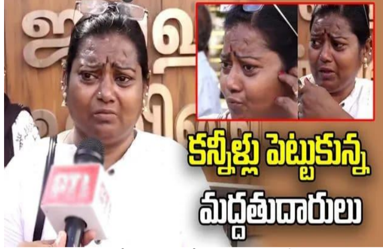
కన్నీళ్లు పెట్టుకున్న మద్దతుదారులు

తమిళనాడు అసెంబ్లీ ఎన్నికల్లో టీవీకే పార్టీ 108 సీట్లు సాధించింది. టీవీకే పార్టీ ప్రభుత్వాన్ని ఏర్పాటు చేయాలంటే 118 సీట్లు కావాలి. ముందు ప్రభుత్వాన్ని ఏర్పాటు చేసే తర్వాత బల నిరూపణకు వెళదామని విజయ్ భావించారు. నిన్న (బుధవారం) గవర్నర్ అరేకర్ ను కలిశారు. అయితే, మెజార్టీ లేకపోవడంతో ప్రభుత్వం ఏర్పాటుకు గవర్నర్ నిరాకరించారు. దీంతో ఈ రోజు జరగాల్సిన విజయ్ ప్రమాణ స్వీకారం కార్యక్రమం క్యాన్సిల్ అయింది..