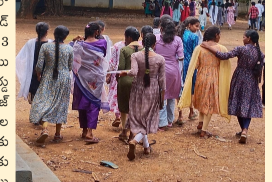
మన దునియా, హైదరాబాద్: మే 07

తెలంగాణ రాష్ట్రంలో ఇంటర్మీడియట్ అడ్వాన్సుడ్ సప్లమెంటరీ పరీక్షలు ఈనెల 13 నుంచి 21 వరకు జరగనున్నాయి. హాల్ టికెట్లను ఇంటర్ బోర్డు అధికారులు గురువారం రిలీజ్ చేయనున్నారు. తొలుత కాలేజీల లాగిన్ లో పెట్టి రెండు రోజులకు స్కూలెంట్ల వాటాను అనుమతించనున్నారు. విద్యార్థులు రిజిస్ట్రేషన్ నెంబర్ తో హాల్ టికెట్లను డౌన్లోడ్ చేసుకోవచ్చని అధికారులు సూచించారు. అడ్వాన్సుడ్ సప్లమెంటరీ పరీక్షలు కోసం మొత్తం 3,97,997 మంది విద్యార్థులు ఫీజులు చెల్లించారు. ఒకేషన్లో విభాగంలో 28,703 మంది విద్యార్థులు ఫీజులు చెల్లించారు. ఈ మేరకు ఇంటర్ బోర్డు అన్ని ఏర్పాట్లు చేస్తుంది. ఇప్పటికే పరీక్షలకు సంబంధించిన షెడ్యూల్ కూడా విడుదల చేసింది. షెడ్యూల్ ప్రకారం ఇంటర్ సప్లమెంటరీ పరీక్షలు మే 13 నుంచి మే 21 వరకు ప్రతి రోజూ రెండు సెషన్లలో జరగనున్నాయి. ఇంటర్ ఫస్ట్ ఇయర్ పరీక్షలు ఉదయం 9 గంటల నుంచి మధ్యాహ్నం 12 గంటల వరకు, సెకండ్ ఇయర్ పరీక్షలు మధ్యాహ్నం 2.30 గంటల నుంచి సాయంత్రం 5.30 గంటల వరకు జరగనున్నాయి.