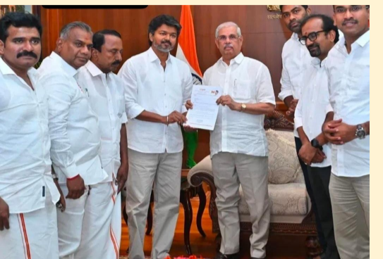
మన దునియా, హైదరాబాద్: మే 07

తమిళనాడులో కొత్త ప్రభుత్వ ఏర్పాటుకు సంబంధించి నెలకొన్న ఉత్సాహకు తెరపడింది. ప్రభుత్వం ఏర్పాటు చేసేందుకు టీవీకే అధినేత విజయ్ కు గవర్నర్ గ్రీన్ సిగ్నల్ ఇచ్చారు. ఇవాళ లోక్ సభలో గవర్నర్ తో రెండోసారి భేటీ అయిన విజయ్.. ప్రభుత్వ ఏర్పాటుకు అనుమతివ్వాలని.. అసెంబ్లీలో బలం నిరూపించుకుంటానని చెప్పారు. 112 మంది ఎమ్మెల్యేలతో ప్రభుత్వాన్ని ఎలా ఏర్పాటు చేయగలరు? ప్రభుత్వాన్ని ఏర్పాటు చేసిన తర్వాత మెజారిటీని ఎలా నిరూపించుకోగలరు అని విజయ్ ని గవర్నర్ ప్రశ్నించినట్లు తెలుస్తోంది, దాదాపు గంటకు పైగా సాగిన ఈ భేటీలో గవర్నర్ పలు కీలక ప్రశ్నలను విజయ్ ముందు ఉంచినట్లు సమాచారం. సభలో ప్రభుత్వ ఏర్పాటుకు 118 మంది ఎమ్మెల్యేల మద్దతు అవసరం కాగా, ప్రస్తుతం టీవీకేకు ఉన్న 112 మందితో పరిపాలన ఎలా సాగిస్తారు?, మెజారిటీకి కావాల్సిన మిగిలిన ఎమ్మెల్యేల మద్దతు ఏ పార్టీల నుండి వస్తుంది? ఇతర పార్టీలు మద్దతు ఇవ్వడానికి అంగీకరించాయా? వంటి ప్రశ్నలను గవర్నర్ విజయ్ ముందుంచారు. అయితే ప్రమాణస్వీకారం తర్వాత అసెంబ్లీలో బలం నిరూపించుకుంటానని విజయ్ చెప్పడంతో గవర్నర్ గ్రీన్ సిగ్నల్ ఇచ్చారు. గవర్నర్ అనుమతివ్వడంతో విజయ్ ప్రమాణస్వీకారానికి ఏర్పాట్లు జరుగుతున్నాయి. ఒకవేళ గవర్నర్ తన అభ్యర్థనను తిరస్కరిస్తే, ఊరికే కూర్చోకుండా చట్టపరమైన మార్గాలను అనుసరించడానికి కూడా టీవీకే సిద్ధమైందని పార్టీ వర్గాల సమాచారం. ఇప్పటికే టీవీకే పార్టీకి కాంగ్రెస్ మద్దతు ప్రకటించగా.. ఇతర పార్టీల మద్దతు కోసం విజయ్ తీవ్ర ప్రయత్నాలు చేస్తున్నారు.